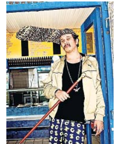
▲ Jack Parow