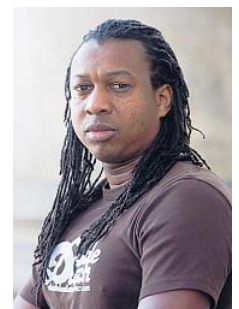
▲ Mc Sherlock